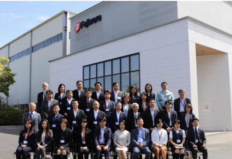
9月第1回企業訪問 (株)フジワラテクノアート