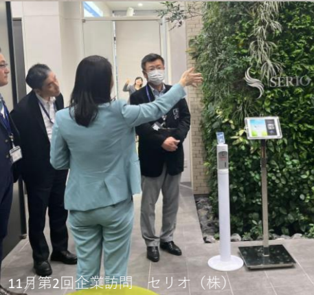
11月第2回企業訪問 セリオ(株)