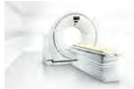
最新CT検査装置 (64ch/128slice CT)

実際の画像でお腹の脂肪がわかります。 健診で内臓脂肪型肥満を疑われた方におすすめします。