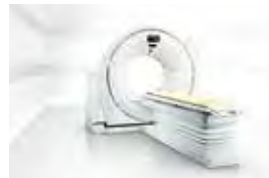
最新CT検査装置 (64ch/128slice CT)