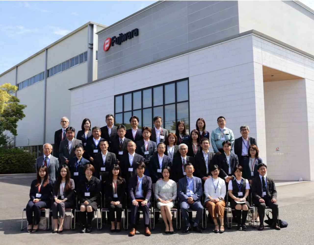
フジワラテクノアート本社ビル前にて参加者集合写真 (5月25日撮影)