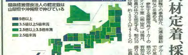
(注)2023年の中小規模法人認定数の20年比