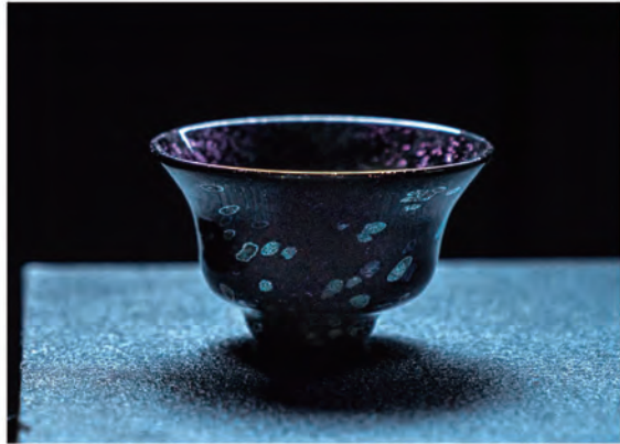
「銀熔変ぐい呑」 6×6×h5.5 cm 吹きガラス 2018

愛媛県に生まれる 1981 倉敷芸術科学大学工芸学科ガラスコース入学 2000 金津創作の森夏のワークショップ参加 2002 新島ガラスアートセンターワークショップ学生アシスタント 2004 赤澤清和氏に師事 AKAZAWAガラススタジオスタッフ、倉敷芸術科学大学専門学校クラフトコース助手 師匠の赤澤清和氏が急逝、赤澤ガラススタジオを引き継ぐ 2005 倉敷にて吹きガラス工房 ぐらすたTOMO設立 2007 受賞歴 第68回 岡山県美術展覧会 <山陽新聞社賞> ※公募工芸部門最高賞 2017 第69回 岡山県美術展覧会 <県展賞> 2018