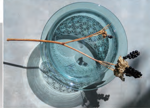
「Vase / Hemp leaf pattern」 16.5×15×h14 cm 吹きガラス・サンドブラスト 2017