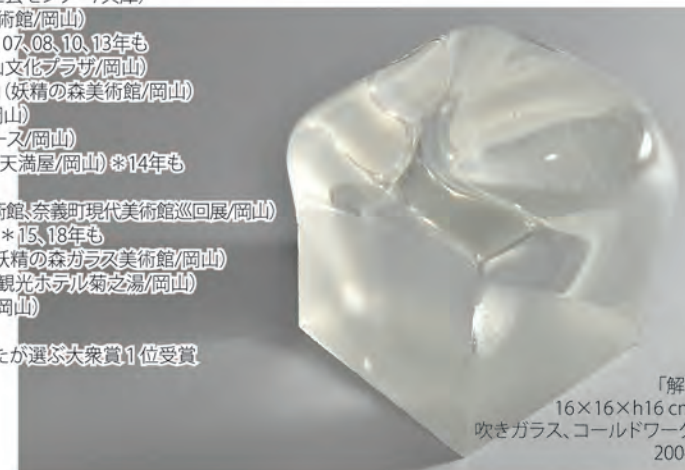
「解」 16×16×h16 cm 吹きガラス、コールドワーク 2004