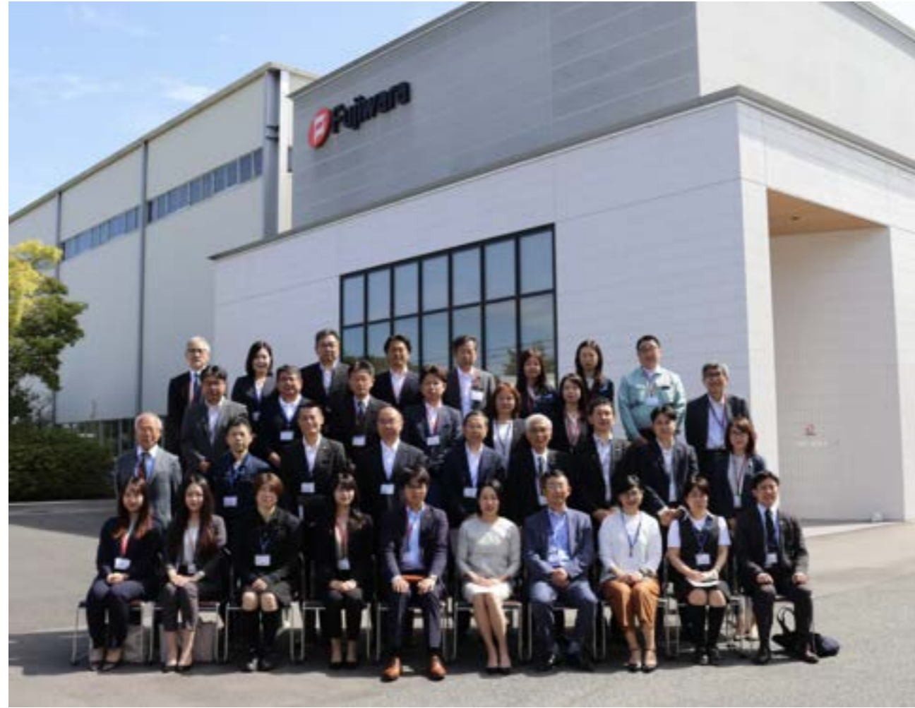
フジワラテクノアート本社ビル前にて参加者集合写真（5月25日撮影）

それぞれの健康施策やノウハウを支援の無い範囲で共有し、重要と考えられる共通の課題については共同検討の機会を設けて、岡山の状況にマッチした施策開発、改善を目指すべく、今般『岡山健康経営を考える会』の設立に至ったものです。 このような取り組みは全国でも珍しく、先進的なものと考えられます。 『岡山健康経営を考える会』は企業と働く従業員の健康ならびに幸せを願う皆で学び、皆で実践することによって岡山の企業の発展と地方発の健康経営の在り方を全国に発信します。